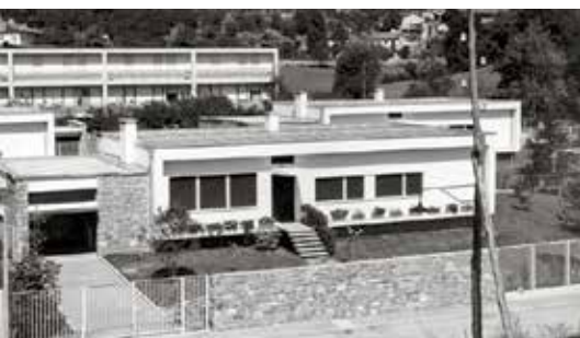
Fototeca Associazione Archivio Storico Olivetti - Ivrea

DALL'ARCHIVIO Case unifamiliari per dipendenti Olivetti, Ivrea, 1952, Marcello Nizzoli e G. Mario Oliveri architetti (Foto Studio Casali, Associazione Archivio Storico Olivetti - Ivrea, Foto del fondo Direzione Servizi Formazione, Stabilimenti e Architetture Olivetti, fascicolo 8).